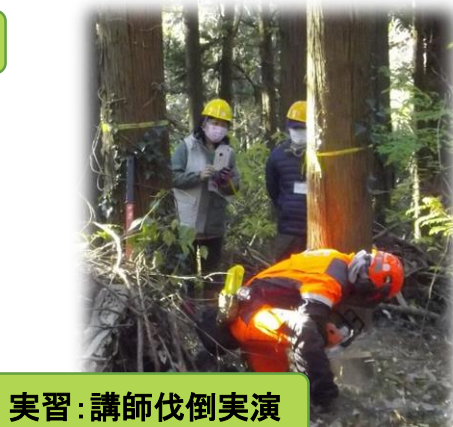
実習：講師伐倒実演