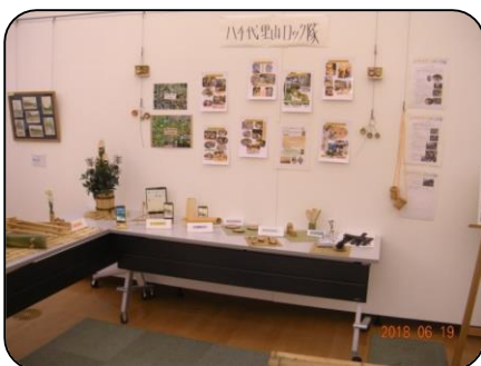
八千代里山ロック隊 (主に6期生) 活動場所：島田台