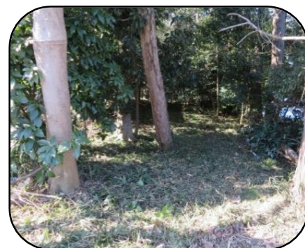
里山フォース会（4期生）