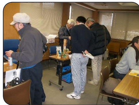
個別相談会の風景