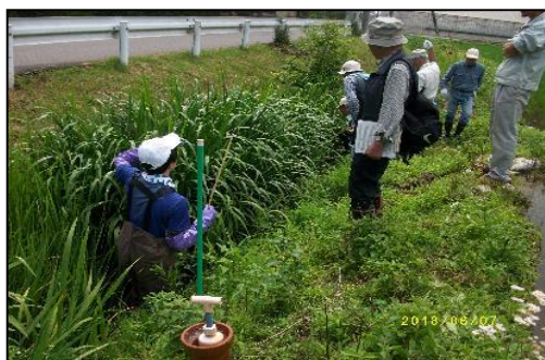
ヤマトミクリの調査