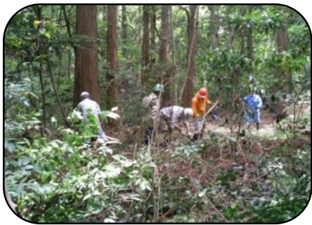
里山むつみ隊（主に1期生）