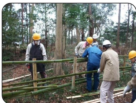
4日目（竹柵作り体験）