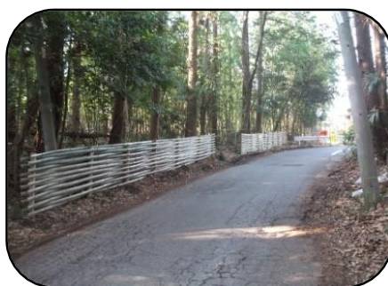
八千代里山ロック隊（6期生）