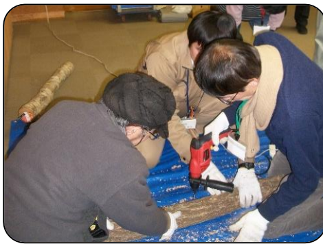
5日目（しいたけの駒打ち体験）