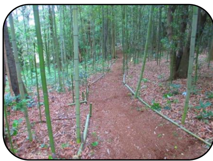
里山・竹の会（主に2・3期生）