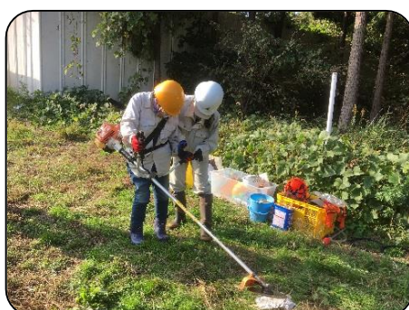
2日目（刈払機の体験）