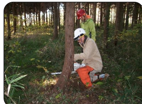
3日目（チェーンソーの体験）