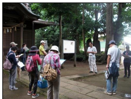
自然観察会（里山歩きの風景）