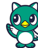
八千代市イメージキャラクター やっち