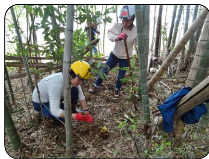
里山・虹の会 (主に7期生) 活動場所：真木野