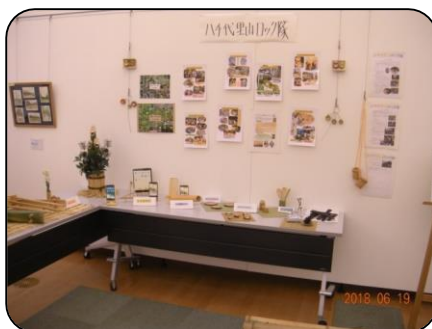
八千代里山ロック隊 (主に6期生) 活動場所：島田台