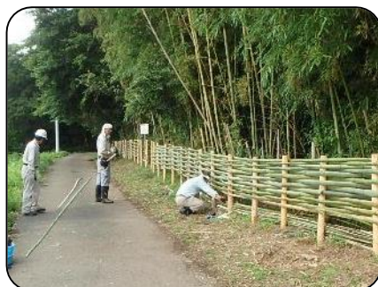
里山・竹の会 (主に2・3期生) 活動場所：大学町・佐山