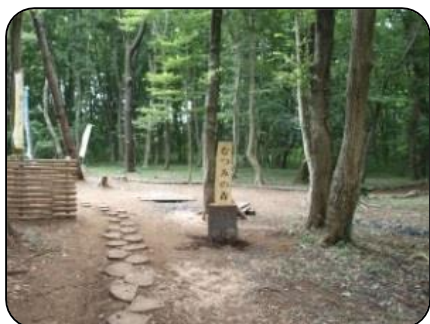
里山むつみ隊 (主に1期生) 活動場所：桑橋・神久保・桑納