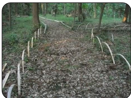
五蘭会 (主に5期生) 活動場所：下高野