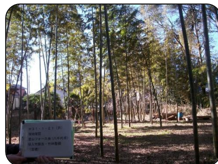
里山フォース会 (主に4期生) 活動場所：吉橋・米本・桑橋