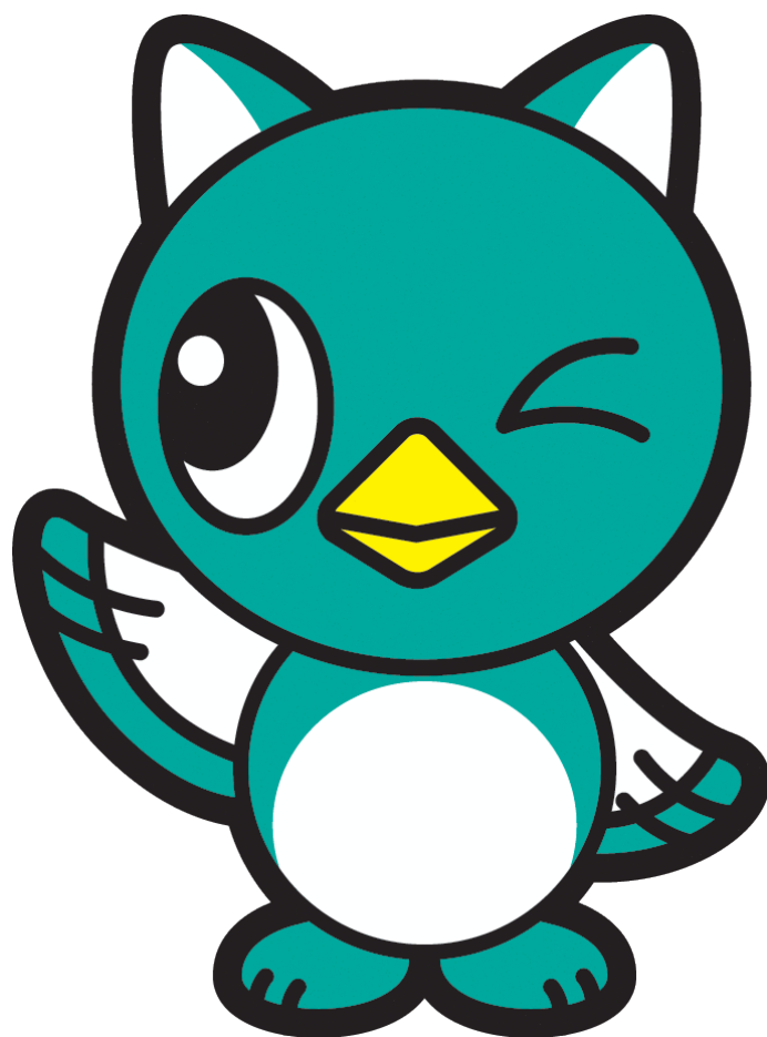
八千代市イメージキャラクター「やっち」