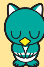
八千代市 イメージキャラクター やっち