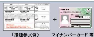
「接種券」(例) マイナンバーカード等