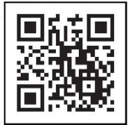
'코로나 백신 나비' QR코드