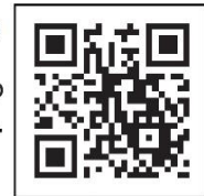
Código QR de navegación de la vacuna contra el coronavirus