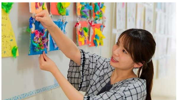
ゆりのき台保育園(保育士) 向保育士

私が働く母子保健課には同年代をはじめ、幅広い年代の職員がおり、保健師だけでなく栄養士や歯科衛生士、助産師等の専門職がいます。困ったときは相談し合うことができ、多角的な視点を持って働くことができます。