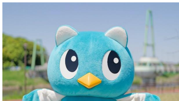
市のイメージキャラクター やっち

公立保育園は8園で、それぞれ距離があまり離れていないので、異動しても環境が大きく変わらずに働き続けられるところが魅力だと思います。異動ではたくさんの方との出会いのきっかけにもなり、自分自身の学びにもなります。