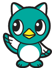
八千代市イメージキャラクター 「やっち」

発行日 平成30年3月 発行 八千代市 編集 財務部 資産管理課 住所 千葉県八千代市大和田新田 312-5 TEL 047-483-1151（代表） FAX 047-484-8824（代表） URL http://www.city.yachiyo.chiba.jp