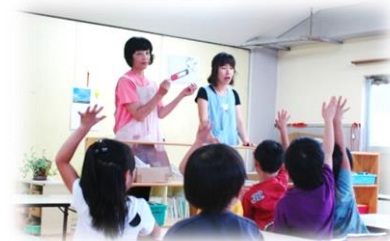
喫煙防止教育の様子

※地域新聞（1/30号）に、「5歳児クラスでの喫煙防止教育」と題した記事が掲載されました。