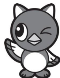
イメージキャラクター やっち

【本調査に関する問い合わせ先】 八千代市 子ども部 子育て支援課 電話：047-483-1151（内線 2271） E-mail：kosodate3@city.yachiyo.chiba.jp