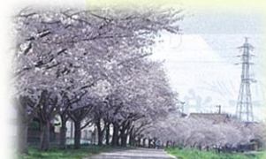
新川遊歩道千本桜