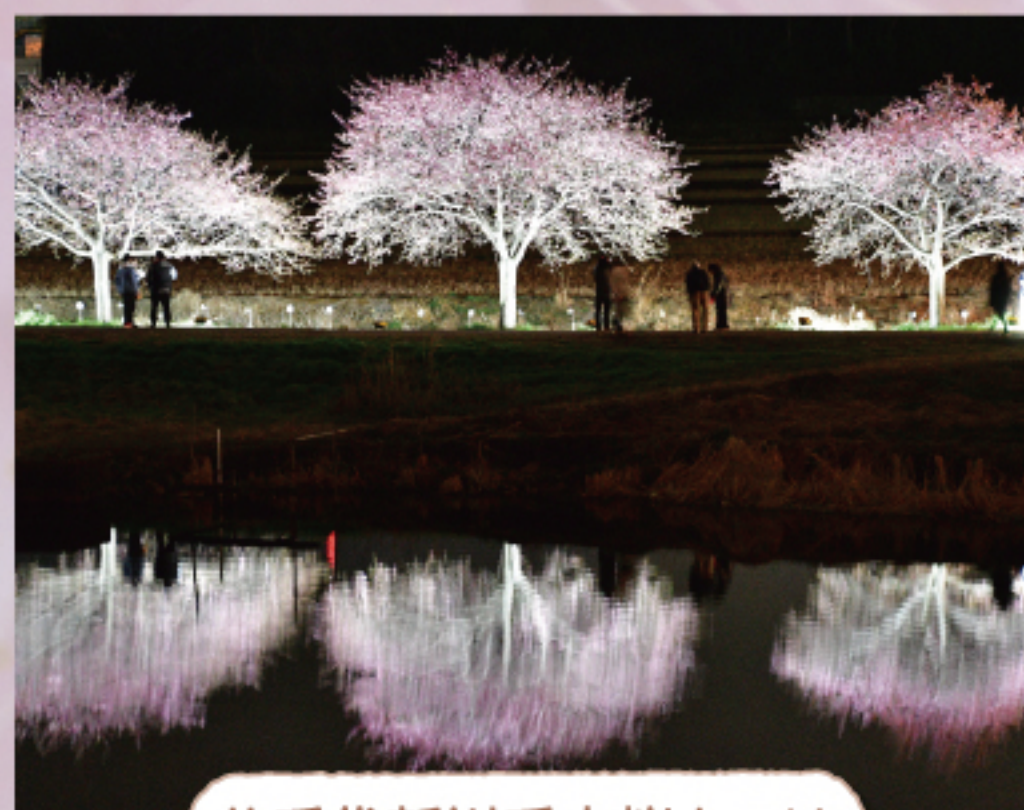
八千代新川千本桜まつり