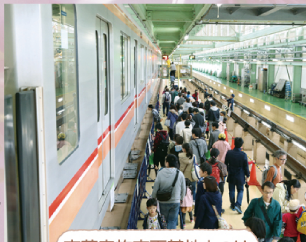
東葉家族車両基地まつり