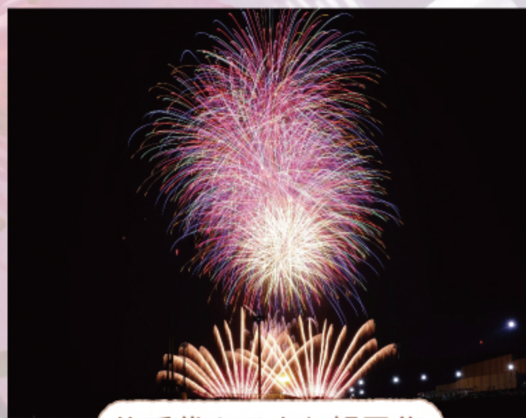
八千代ふるさと親子祭

京成バラ園 春のバライベント 緑が丘ローズハーツ ふれあいフェスタ ヤルシェ〜八千代のマルシェ〜 東葉健康ウォーク