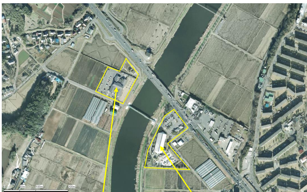
やちよ農業交流センター