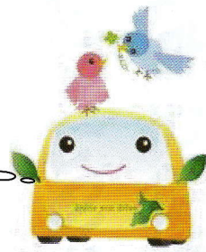
エコドライブキャラクター 「エコ丸クン」