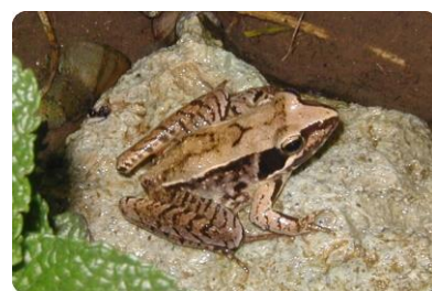
ニホンアカガエル