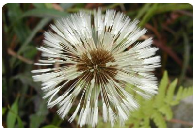
タンポポのわたげ