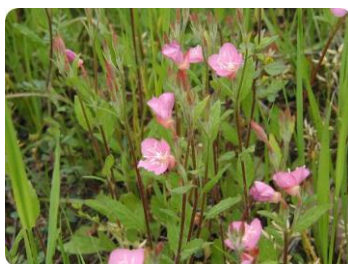
アカバナユウゲショウ