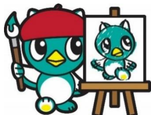
八千代市イメージキャラクター「やっち」