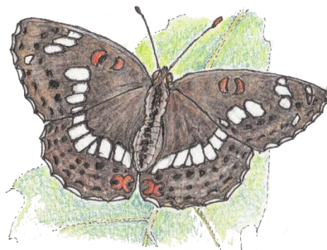
イチモンジチョウ♀