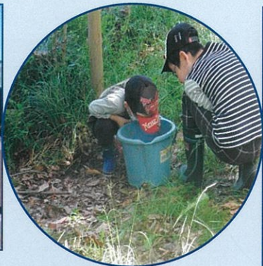
ザリガニ釣れたよ！