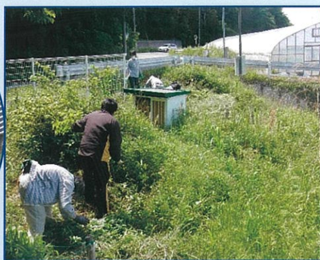
草刈り・枝拾いなど