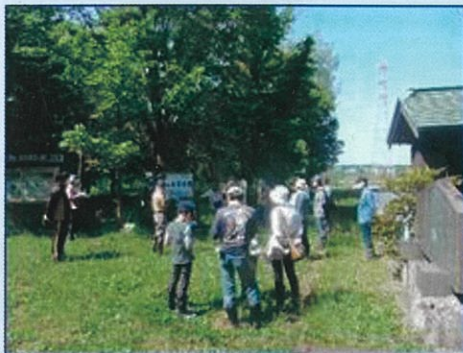
TOTO（株）さんも久しぶりの参加