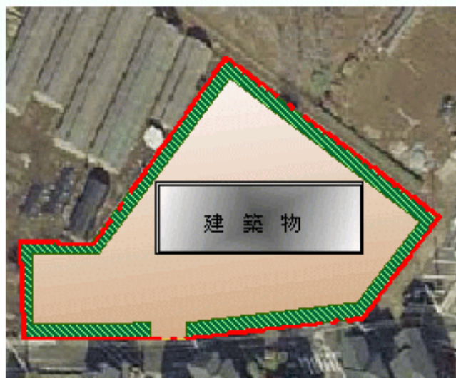
一敷地の単体的な開発行為