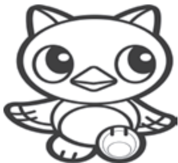
八千代市のイメージキャラクター

※入場整理券を他人に渡して投票させたり、氏名を偽って投票すると罰せられます。また、投票所において、正当な理由がなく選挙人の投票