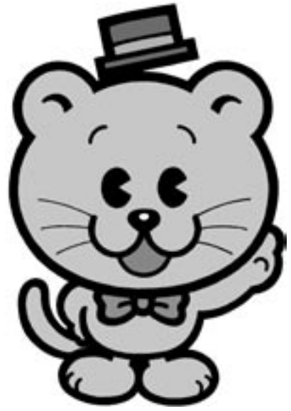
ぼく「せんきょ君」です。

7月29日(日)は、参議院議員選挙の投票日です。 今後の国政を託す人を選ぶ大切な選挙です。 あなたの一票をムダにしないで投票しましょう。