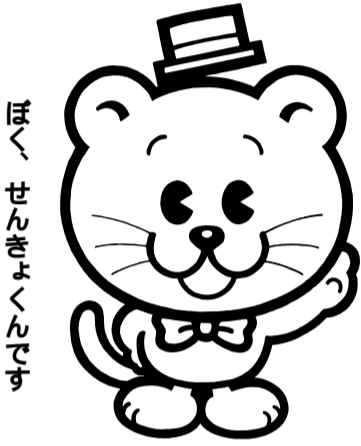
ぼく、せんきょくんです

平成17年6月2日以降に八千代市に転入届をした人は、本市の投票所では投票できません。次のいずれかの方法で投票することができます。ただし、前住所地の選挙人名簿に登録されていることが必要です。(衆議院議員選挙は、前住所地の市区町村の属する選挙区の候補者等に投票することになります。) 前住所地の選挙管理委員会へ投票用紙などを請求し、これを八千代市の選挙管理委員会に投票日の前日(9月10日(土))までに持参して、不在者投票をする方法。この場合郵送等のやり取りになりますので、手続きは至急行ってください。請求に必要な書類は、市役所5階選挙管理委員会、1階戸籍住民課、支所・連絡所にあります。 投票日の前日(9月10日(土))までに、前住所地の期日前投票所へ行って期日前投票する方法。 投票日当日(9月11日(日))に、前住所地の投票所へ行って投票する方法。