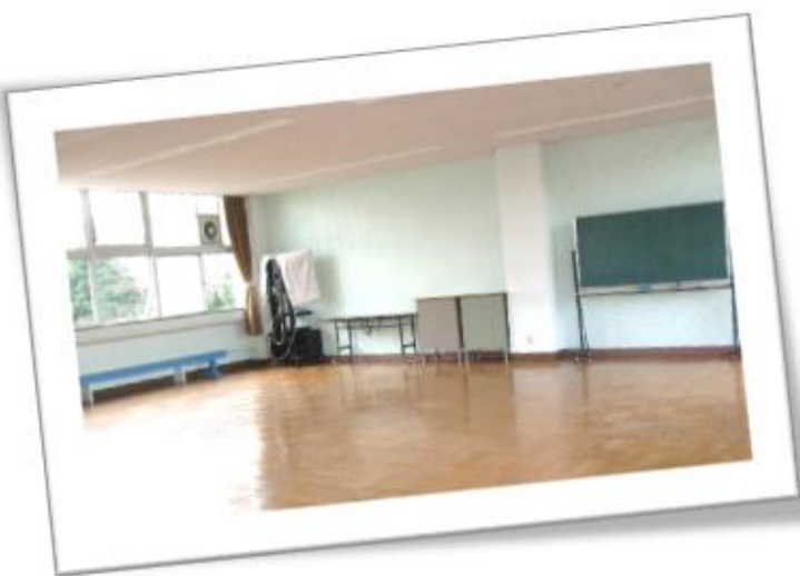
【2階】講習室（定員 60 名程度）

会議・講演会・運動等の多用途に利用できます。（広さ：105 m 2 、テレビ、机、椅子、黒板等）