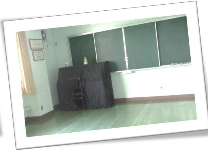
【2階】視聴覚室（定員 25 名程度）

会議・講演会・運動等の多用途に利用できます。（広さ：105 m 2 、テレビ、机、椅子、黒板等）