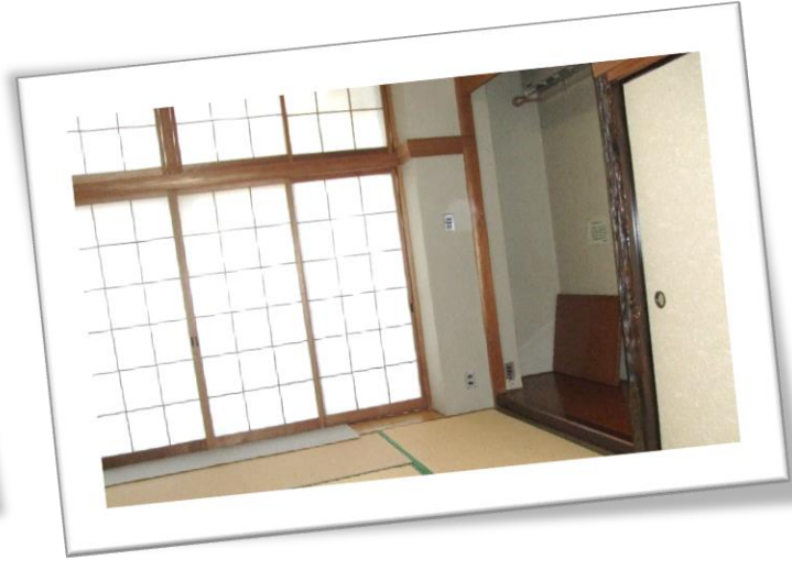
【2階】和室（定員 10 名程度）

少人数の会議・学習等に利用できます。（広さ：32.5 m 2 、ピアノ、机、椅子、黒板等）