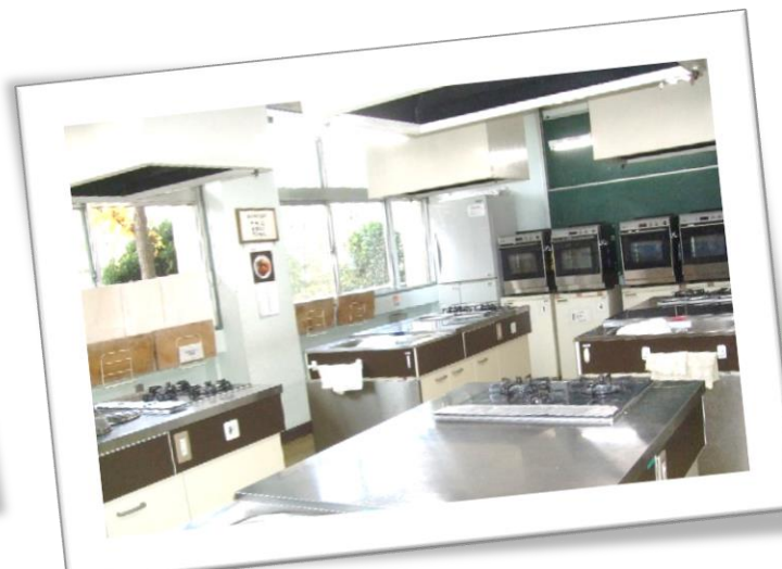
【1階】調理室（定員 20 名程度）

工作台が 4 台あり、主に陶芸、木版画、絵画等に利用できます。（広さ：55 m 2 、陶芸窯、黒板等）