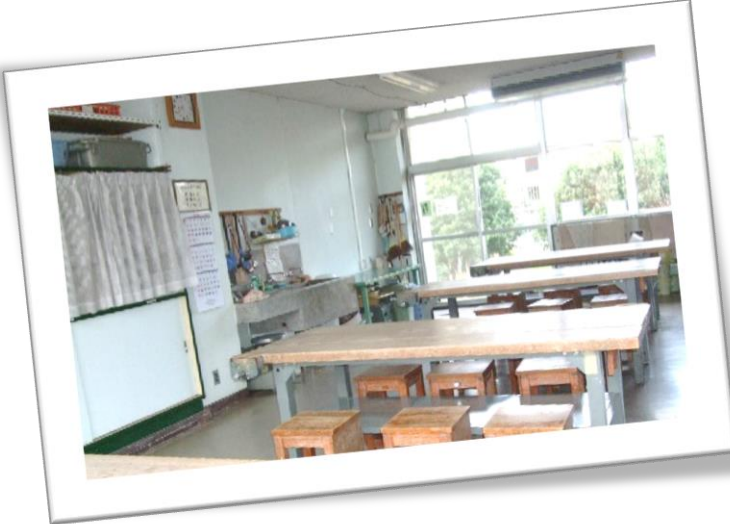
【1階】工作室（定員 24 名程度）

工作台が 4 台あり、主に陶芸、木版画、絵画等に利用できます。（広さ：55 m 2 、陶芸窯、黒板等）