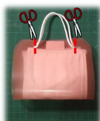
③マスクのひもが出る部分に切り込みを入れ、ひもをかける。