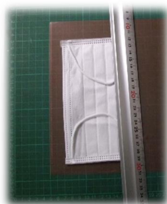
①クリアファイルをマスクの大きさに合わせて切る。