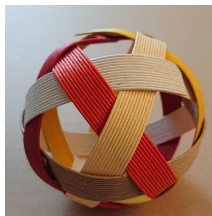
手芸用紙バンドで作ったボール

* PPバンドテープ ：荷造り梱包用のバンド * このバンド以外に、手芸用紙バンド（色がたくさんあります）でも作れます。 * セパタクローのボールもこの形です。競技用はプラスチック製でできています。（以前は籐製でした）