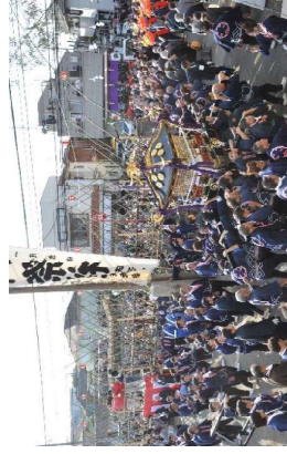
神輿は定められた順に従って、二宮神社に向って移動します。