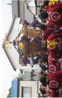
花流しの様子（高津比咩神社）