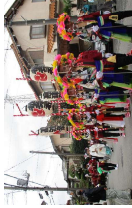
花流しの様子（高津比咩神社）