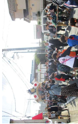
花流しの様子（時平神社）