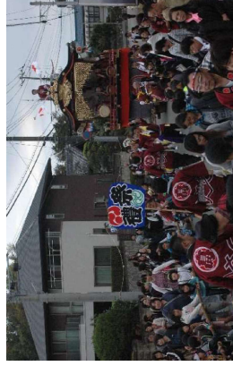
花流しの様子（高津比咩神社）