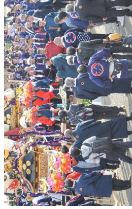
神前場では神職によるお祓いが行われます。