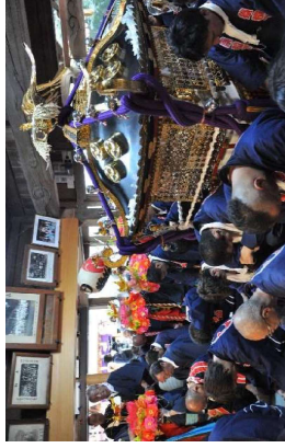
昇殿参拝の様子（時平神社）