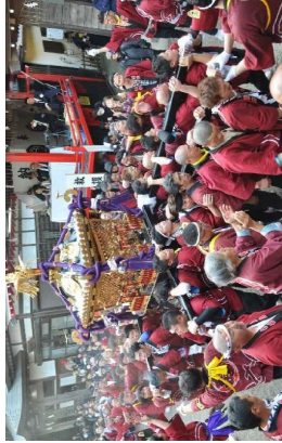
昇殿後に参加しない神輿は各々の地区に戻ります。（高津比咩神社の神輿は、境内を一周してから帰ります。）