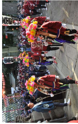
高津比咩神社の一行が二宮神社に到着しました。