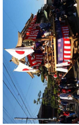
花流しの様子（時平神社）