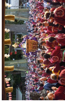
神輿も二宮神社境内に入り、拝殿前でもまれまです。