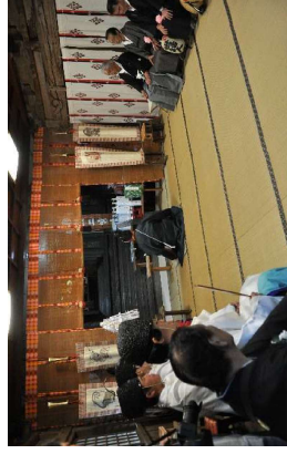
昇殿後、神事が執り行われます。