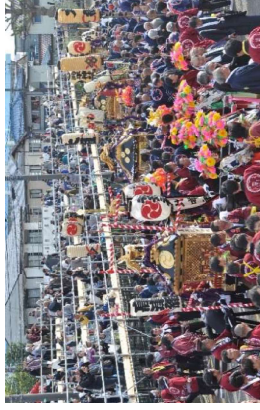
神前場に各神社の神輿が集まりました。