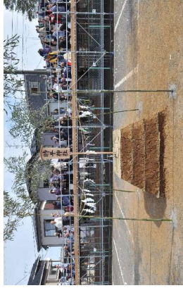
船橋市三山の神前場（かみそろいば）で神輿を乗せるオツツカです。