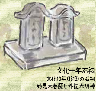
文化十年石祠 文化10年(1813)の石祠 妙見大菩薩と外記大明神

勝田・勝田台コース 行程5.7km 移動時間1時間30分 京成本線勝田駅・東葉高速線東葉勝田台駅～五丁目西バス停～ボンテン塚～円福寺～駒形神社～馬頭観音塔～馬橋の庚申塔群～勝田台市民の森～八勝園市民の森～勝田台中央公園～勝田台コミュニティ道路～勝田台駅