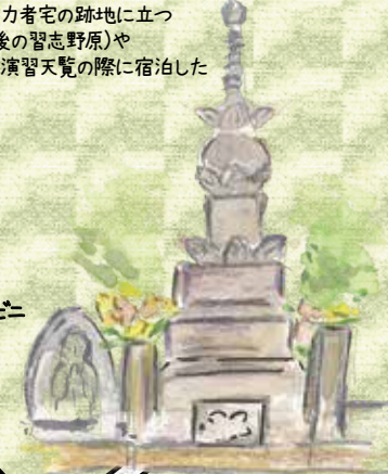
長妙寺の 伝・八百屋お七の墓

明治天皇行在処の碑 大正11年(1922) 大和田の有力者宅の跡地に立つ 大和田原(後の習志野原)や 下志津原の演習天覧の際に宿泊した