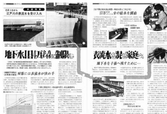
▲江戸川の表流水の取水を伝える当時の広報やちよ(昭和54年5月15日号)