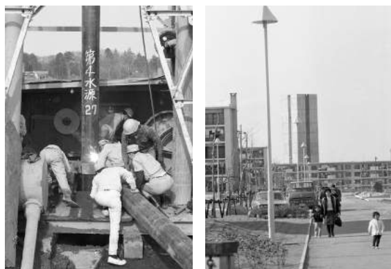
▲井戸の掘削工事(昭和41年撮影) ▲米本浄水場の高架水槽(昭和46年撮影)

このように、都市化の進展に対応した給水区域の拡大と施設能力の充実を図ってきた結果、平成28年度末時点の給水人口は19万4千人となり、本市人口のおよそ99%に水道が普及しています。