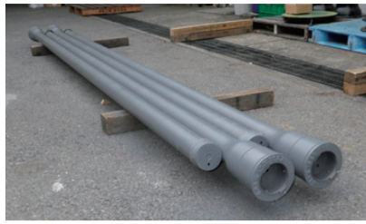
▲GX形ダクタイトル鉄管

G X形ダクタイトル鉄管は、現在まで使用されてきた水道管に比べて、施工性が飛躍的に向上するとともに水道管の長寿命化が実現できる新しい耐震管です。従来の水道用鉄管の耐用年数は40年でありましたが、この水道管は、特殊な外面耐食塗装により約100年は腐食しないといわれ、耐久性に優れています。八千代市では、平成26年度からこのGX形ダクタイトル鉄管を使用します。