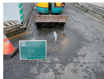
▲道路上で漏水している現場

皆様にお届けする大切な水を守るために、配水管や給水管の漏水調査を実施しています。皆様からの連絡も大切な情報となっていますので、道路上などで漏水を発見された場合には、お手数ですが上下水道局までご連絡をお願いします。