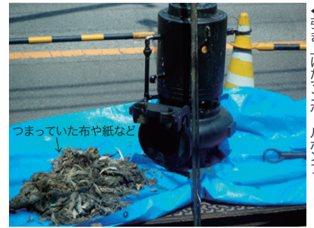
▲引き上げたマンホールポンプ

最近、紙オムツ、タオル等の大きな異物や水に溶けにくいウエットティッシュなどが下水道に流され、地形などにより下水を低い位置から高い位置に汲み上げるマンホールポンプという送水施設が詰まり、停止する事が多くあります。この施設が壊れると、汚物が道路にあふれ、下水道の使用ができなくなりますので、下水道の正しい使用をお願いします。