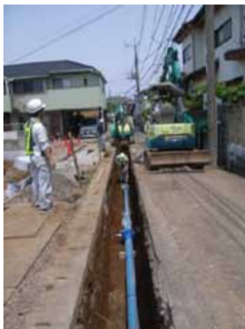
耐震管を地中に設置する工事

本市の水道管は、市民生活に欠くことの出来ないライフラインとして、昭和42年から八千代市の急成長とともに整備してきました。