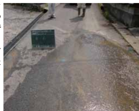
▲道路上で漏水している現場