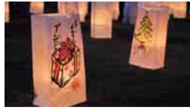
▲幻想的なキャンドルの光が、辺り一面に広がります