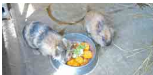
◀ボルピィ牧場で飼育しているウサギたち

また、飼育委員会の児童だけではなく、野菜を持ってきた児童が自分でえさをあげることもできるので、児童が動物と触れ合う機会