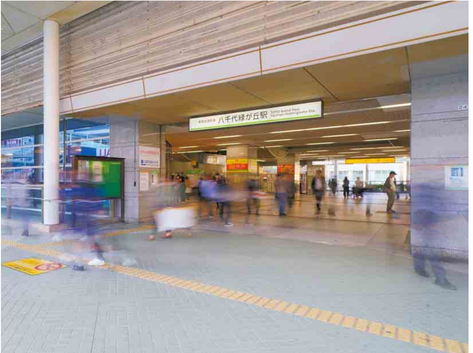
▲八千代緑が丘駅南口のペデストリアンデッキから。東葉高速鉄道の市内駅では最も乗降者数が多い駅となっています

12月もう半ば。2022年(令和4年)も残りわずかとなりました。師走に入ると、何かと気ぜわしく、人の動きも慌ただしくなります。また、この時期は例年、犯罪や火災、事故が増える傾向にあります。犯罪や事故を未然に防ぎ、年末を楽しく安全に過ごすために、外出をする時は、戸締りや火の元を改めて確認するなど意識を高め、気持ちよく新たな年を迎えましょう。