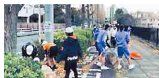
◀清掃活動中の児童・生徒たち

ました。現在は、児童・生徒たちだけでごみ拾いや雑草を抜くなど、学校周辺の美化活動を行っていますが、コロナ禍が落ち着いたら、以前のように保護者や、近隣の高校生など多くの人たちと協力して活動を続けていく予定です。