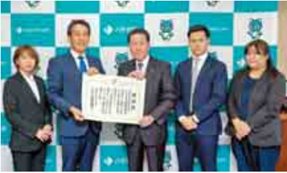
▲服部市長と明治安田生命保険相互会社船橋支社長、社員のみなさん

11月24日、市から同社に対し、感謝状と記念品を贈呈しました。いただきました寄附については、地域子育て支援に活用さ