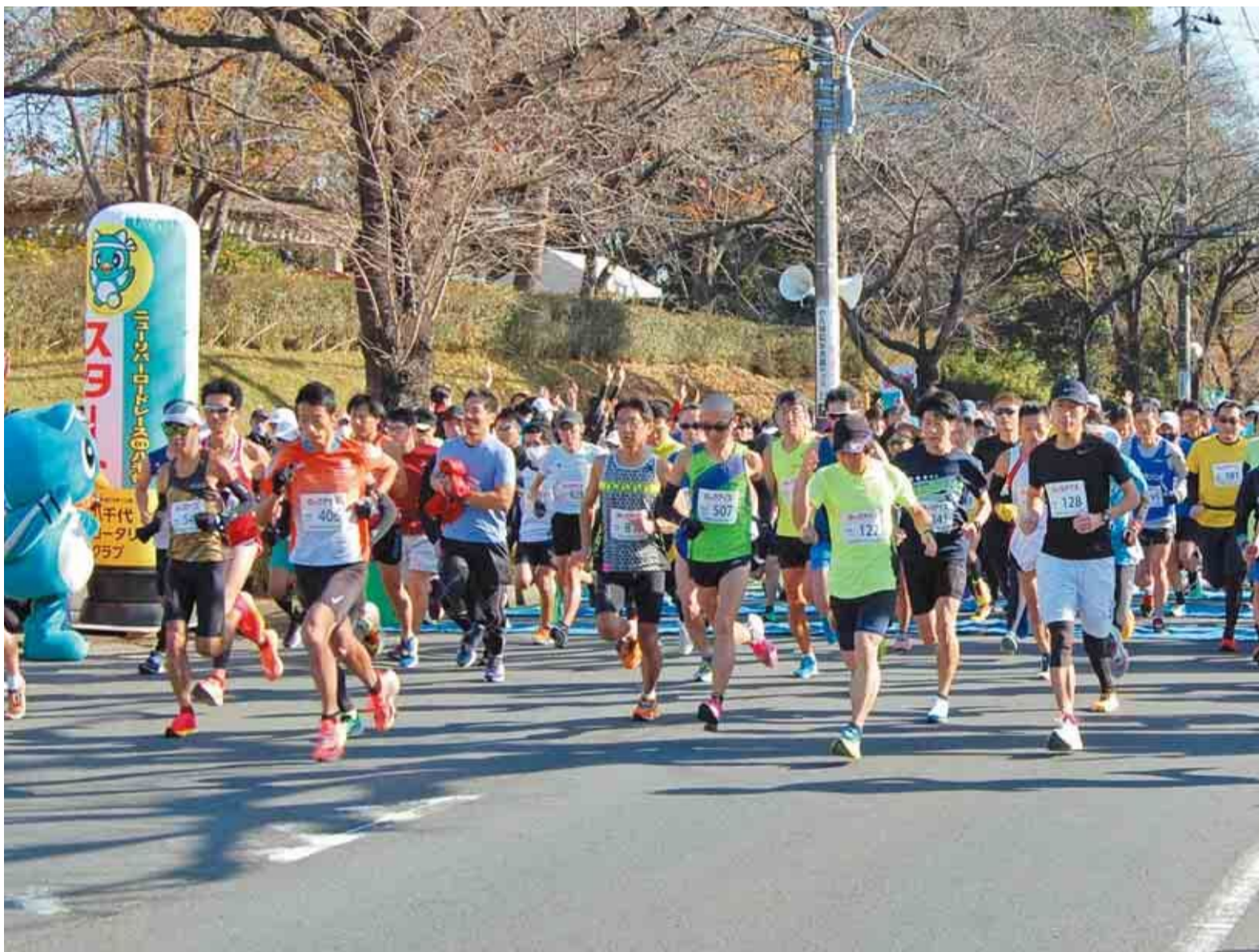
▲市民会館前をスタートする10マイルレースの参加者

12月4日、ニューリバーロードレース in 八千代が3年ぶりに開催され、約2,200人のランナーが晴天の中、力走しました。