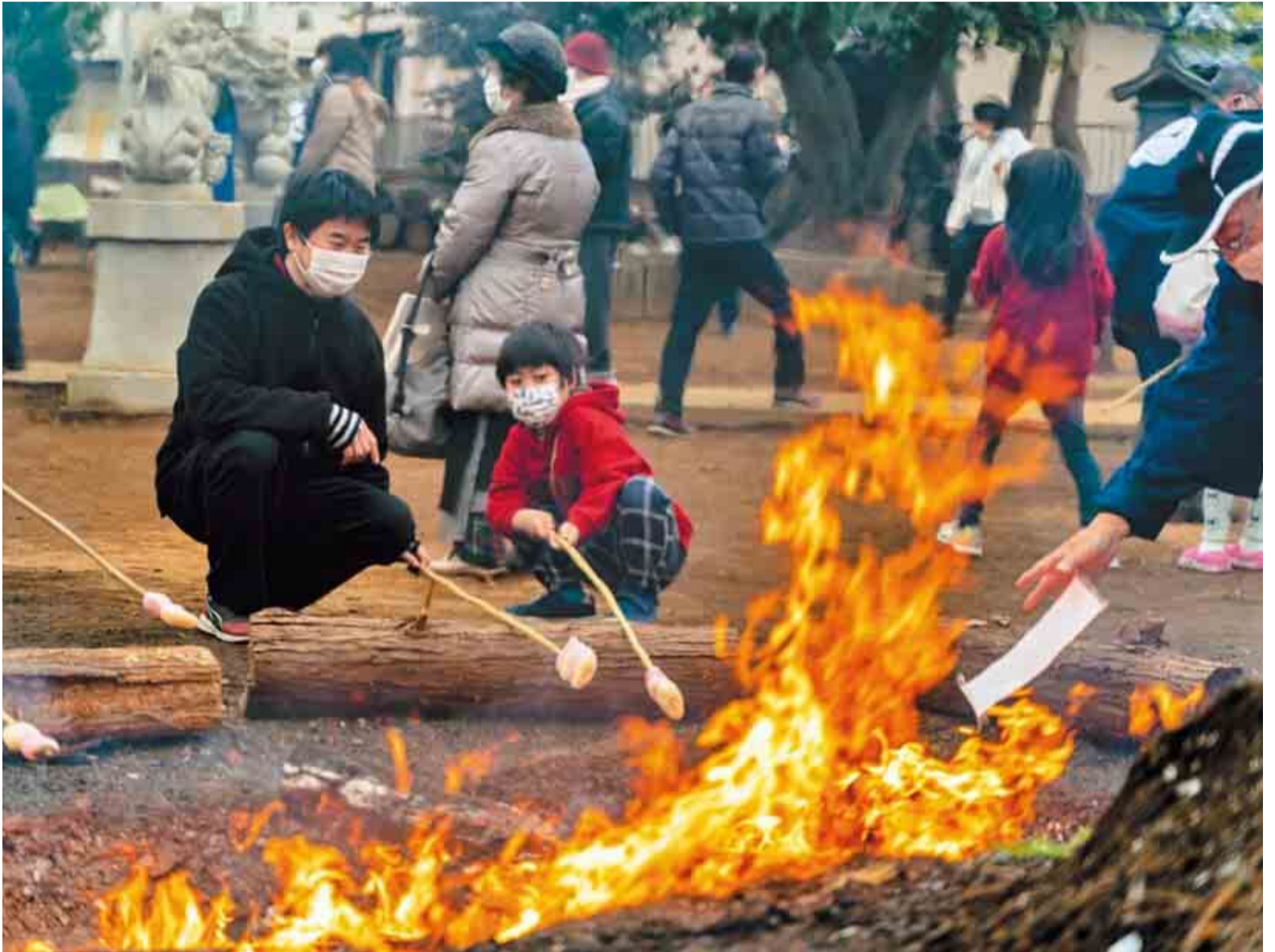
▲小板橋時平神社のどんど焼きでは縁起が良いとされる紅白餅を焼きました。餅は地元大和田の和菓子屋さんが作っています

1月14日～16日の小正月には、全国各地で火祭り(どんど焼き)が開催されます。どんど焼きは小正月行事として、書き初めや正月飾りなどをお焚き上げする地域の行事のことです。小板橋時平神社では、大和田にある時平神社から昭和16年に勧請されて以来、毎年行われています。お焚き上げで焼いたお餅や団子などをいただくことで、その年の無病息災が叶うといわれています。