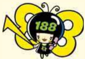
▲消費者ホットラインイメージキャラクター イヤヤン

全国どこからでもつながる局番なしの3桁の消費者ホットライン188 (いやや!) もご利用ください。音声ガイダンスに従って、自宅の郵便番号を入力すると、最寄りの相談電話につながります。休日でも県の消費者センターや、国民生活センターを案内します。年末年始を除いて、原則毎日利用できます。