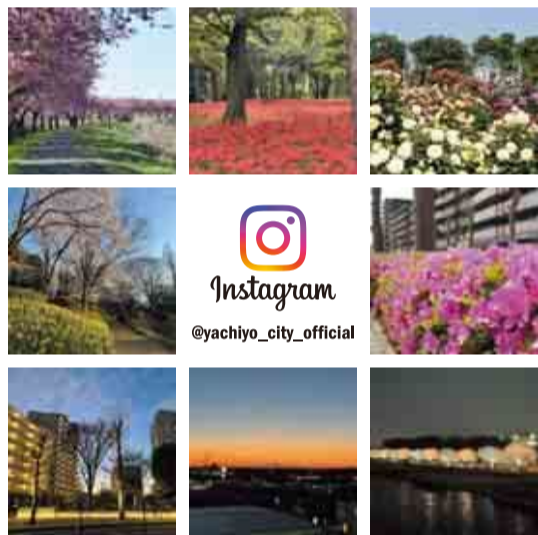
▲写真や動画と合わせて魅力情報を発信します