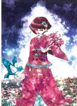
お彼岸の八千代 やちよ(村上)の彼岸花 | 作:omisou