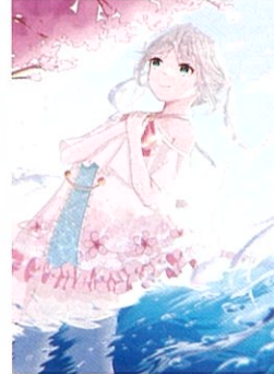
千河 美桜(ちがみおう) 新川、新川千本校、ゆらゆら橋 | 作:びるつ