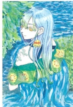
百合川ニーナ 新川、ユリノキ | 作:ふたば星人