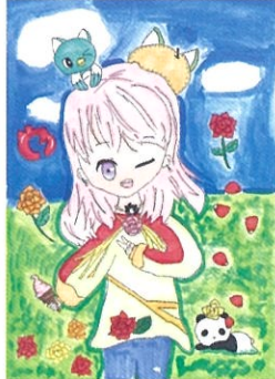
マチ バラ園、梨、やっち | 作:ねこ☆