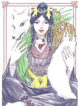
うがたま様 飯綱神社 | 作:チ川ユボ