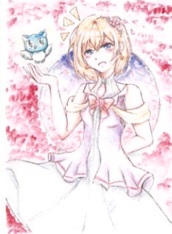
薔 咲華(みずたでしようか) バラ | 作:うさはや