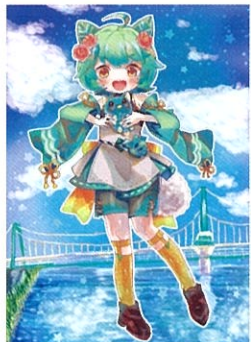
やっちくん やっちの擬人化 | 作:しくれ