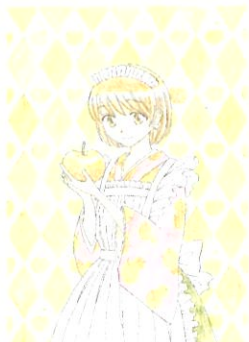
梨々(りり)ちゃん 梨