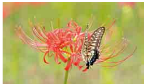
アゲハ蝶も蜜に誘われて

村上緑地公園は、彼岸花の群生地として、(公財)八千代市地域振興財団と市民ボランティアの方々が、見守りと清掃などの活動をしています。