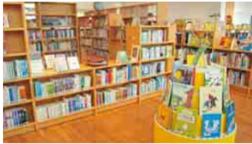
◀TRC八千代中央図書館の児童図書エリア

児童室や児童図書エリアでは、絵本や読み物、百科事典など、年齢に合わせた本をそろえています。0歳から参加できるおはなし会などのイベントも開催しています。