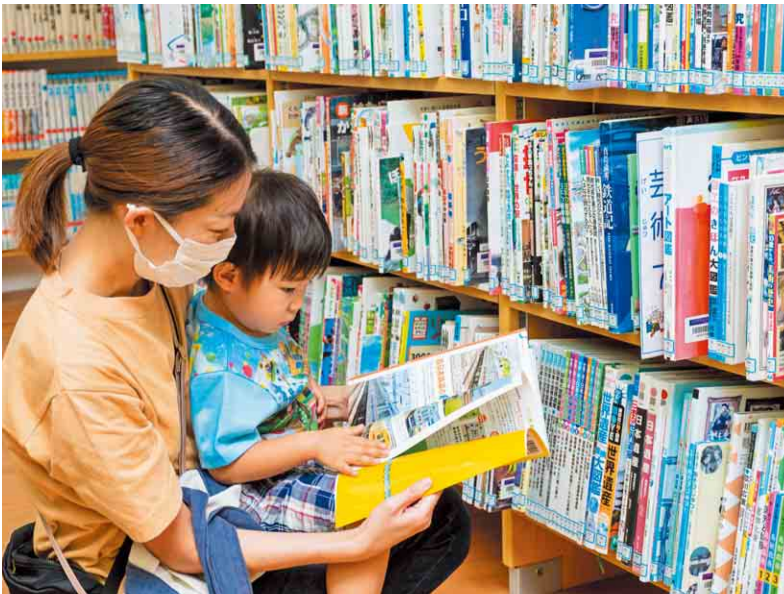
▲市の図書館には約57万冊の本があります。このうち、児童書が約16万冊あり、お気に入りの本を親子で探す楽しみもあります

10月27日(木)～11月9日(水)は読書週間です。市の図書館では、インターネットで電子書籍を読むことができる電子図書館も導入しており、自宅などで、約1万点の中から探して読むことができます。借りた書籍は貸出期間が終了すると自動で返却されます。