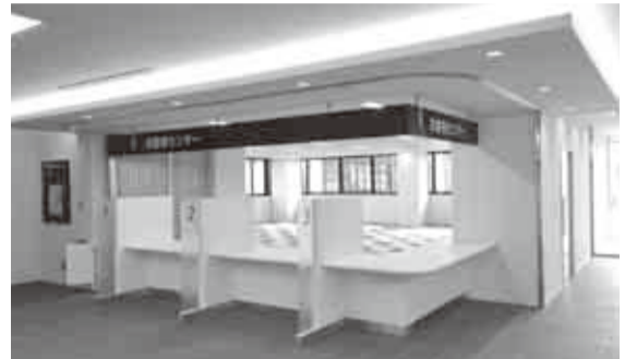
▲正面玄関から右手方向に進むと、お客様センター窓口があります

水道料金・下水道使用料の徴収などを委託している第一環境株式会社八千代営業所が、上下水道局新庁舎お客センターに移転するため、11月14日(月)以降、上下水道の使用開始・中止のお届けや料金のお支払いに関するお問い合わせは上下水道局お客センター ☎409-8655へお願いします。営業時間は祝日・振替休日・年始(1月1日～3日)を除く月曜