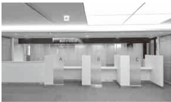
▲正面玄関を入ると左手奥に給水装置・排水設備工事の申請などの受け付けを行う給排水相談課があります

11月14日(月)から上下水道局庁舎が市役所本庁舎敷地内に移転します。新庁舎は環境に配慮したエコガラスや高効率空調設備などを導入しました。また、震度7程度までの耐震性や停電時に庁舎機能を72時間維持できる非常用発電機を備え、予期せぬ災害発生時においても、迅速な災害対応が可能です。