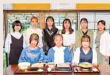
◀私たちが考案しました

栄養学を学ぶ和洋女子大学の学生と市内のそば店有志で作る「やちよ蕎麦の会」が、3種類の新メニューを共同開発。今年のテーマは「八千代をイメージできるそば」。学生と蕎麦職人が試行錯誤して考案した新感覚そばを期間・数量限定で販売します。詳しくは右のコードから。 ▶販売期間 ①豚しゃぶ梨そば／10月17日(月)～26日(水) ②ちゃんぽんそば／10月27日(木)～11月5日(土) ③韓国風ロゼそば／11月6日(日)～15日(火) ▶実施店舗 市内5店舗 ▶お問い合わせ 八千代産学官協同ネットワーク運営協議会事務局(八千代商工会議所内) ☎483-1771 (商工観光課)