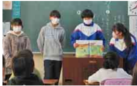
▲1年生に本の紹介をする図書委員の皆さん

開校から間もなく1周年を迎える阿蘇米本学園では、5～9年生の図書委員会の活動として、全学年の子ども達に、学校図書館の図書の紹介活動を行い、読書の楽しさを伝えました。義務教育学校である同校では、前期課程と後期課程の子ども達のつながりにより、リーダーシップや責任感を養っています。