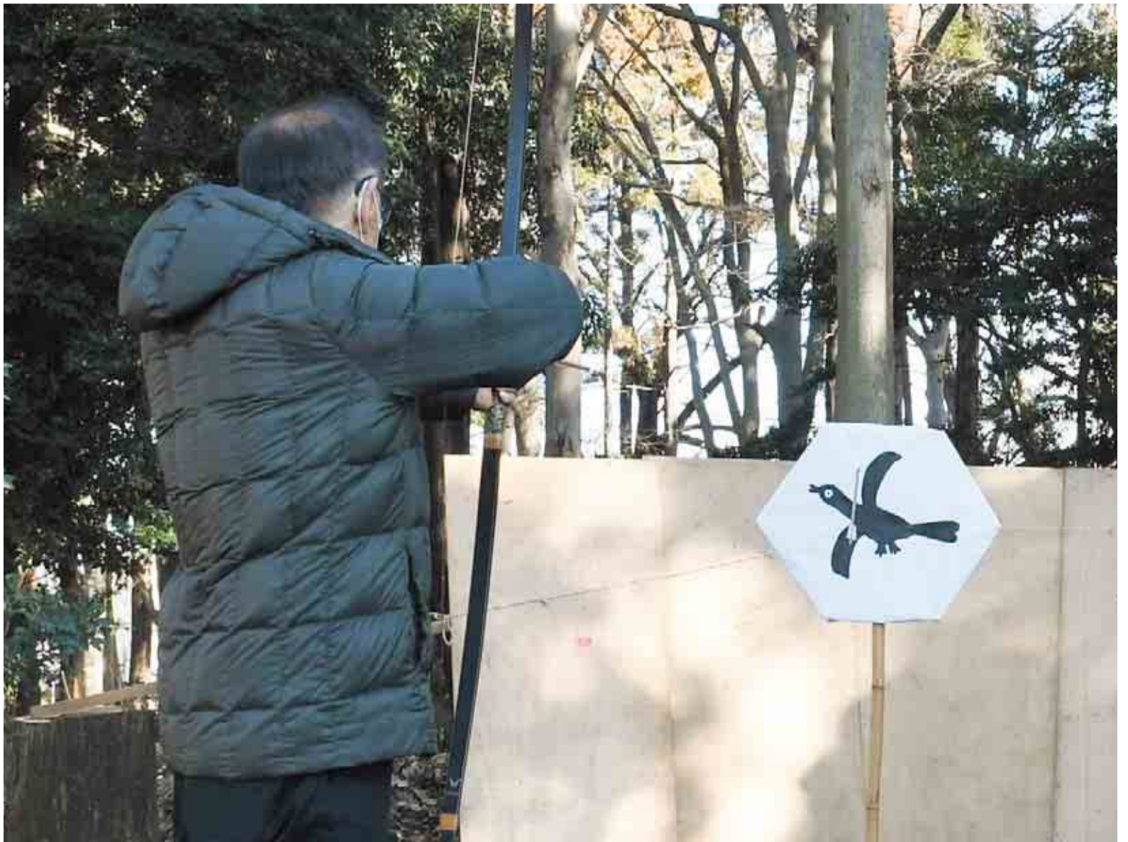
▲諏訪神社本殿前での式典の後、氏子総代から順番にカラス比的に矢を射ます

2月11日に八千代台西の諏訪神社で、五穀豊穡と無病息災を祈願するカラスビシヤ(オビシヤ)が行われました。オビシヤは春先にかけて行われる農耕儀礼の神事で、高津比咩神社のハツカビシヤとともに市の文化財に指定されています。弓射の後に行われる、オトウ(御神体)ワタシでは、半分に切った大根に塩をつけて頭をすり、次の当番の背中に入れて渡され、直会(神祭後の酒宴)が催されました。