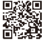
▲農業交流センターHP

▶問い合わせ 源右衛門祭実行委員会事務局(八千代商工会議所内) 483-1771 (観光推進室)