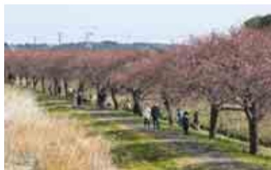
▲遊歩道も多くの人で賑わいました

3月4日・5日に八千代新川千本桜まつり2023が道の駅やちよで開催されました。新型コロナウイルス感染症の影響で4年ぶりの開催となる今回は、和太鼓演奏や源右衛門鍋、キッチンカーなどの出店のほか、夜には河津桜並木が自然エネルギーによりエコライトアップされ、会場は多くの来場者で賑わいました。