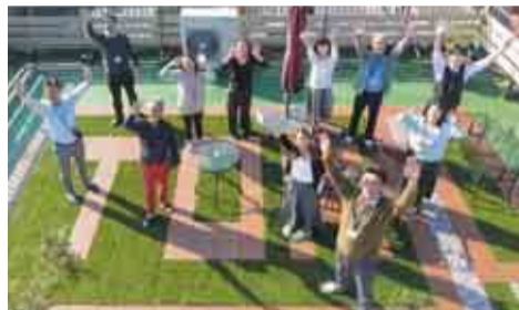
▲(株)東亜オイル興業所の社員の皆さん

八千代商工会議所では、市内全てのサービス事業者や会議所会員の中から、優れたサービスをつくり、届けることに積極的に取り組んでいる事