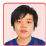
睦小 睦 翔

僕は、今まで行けなかった旅行に行き、テレビなどでよく見る都道府県のイベントを自分の目で見たり遠くにいる祖父母の家に行ったりしたいです。特に行きたい場所は東北地方です。秋田犬が好きなので、実際に秋田県に行き、直接会ってみたいと思いました。