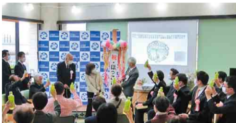
▶オープニングセレモニーも開催されました

ほっこりはみんなの居場所として、相談の場として、地域の人や団体をつなげ、地域課題の解決に取り組んでいきます。