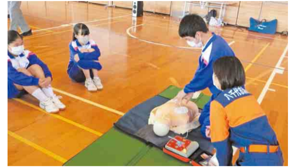
▲旧阿蘇中学校の生徒が消防職員からAEDを使った救急救命講習を受講している様子

市内の中学校では、災害が起きたとき、それぞれのコミュニティで中心を担う学校・生徒となれるよう、地域へ貢献できる生徒の育成を目指し、防災教育にも力を入れています。