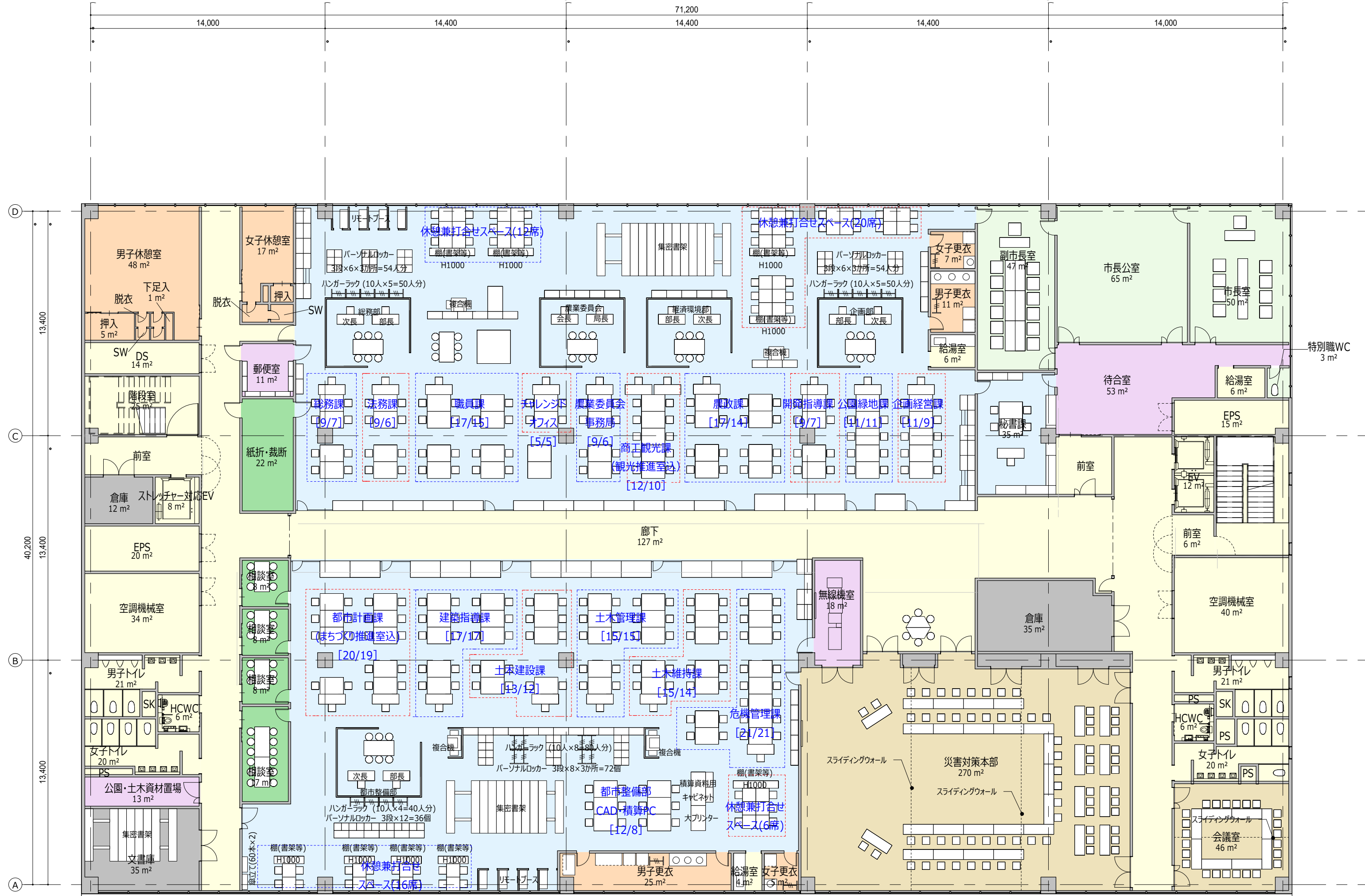
■ 3階平面図 2,950㎡ A3:1/200