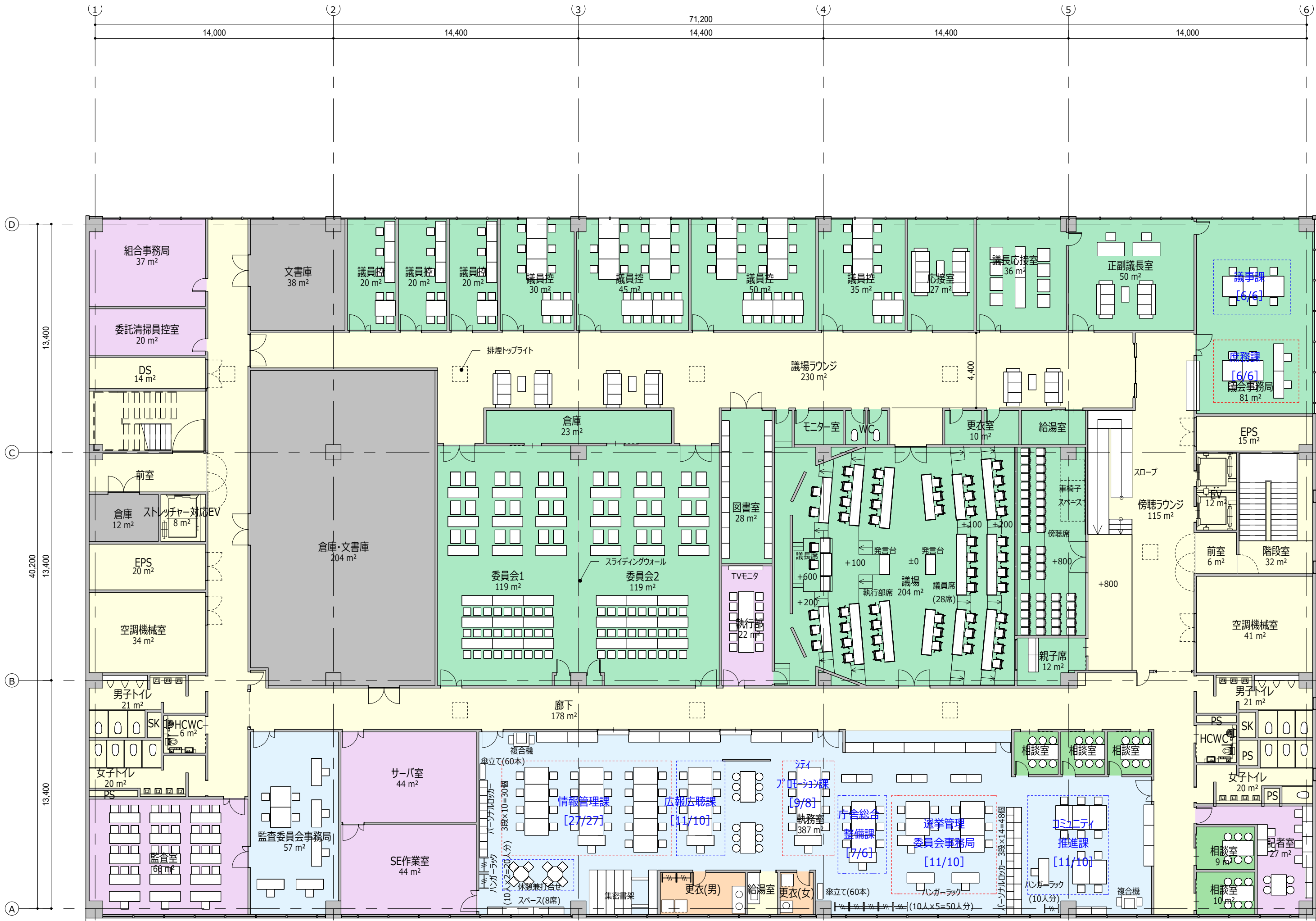
4階平面図 2,950㎡ A3:1/200