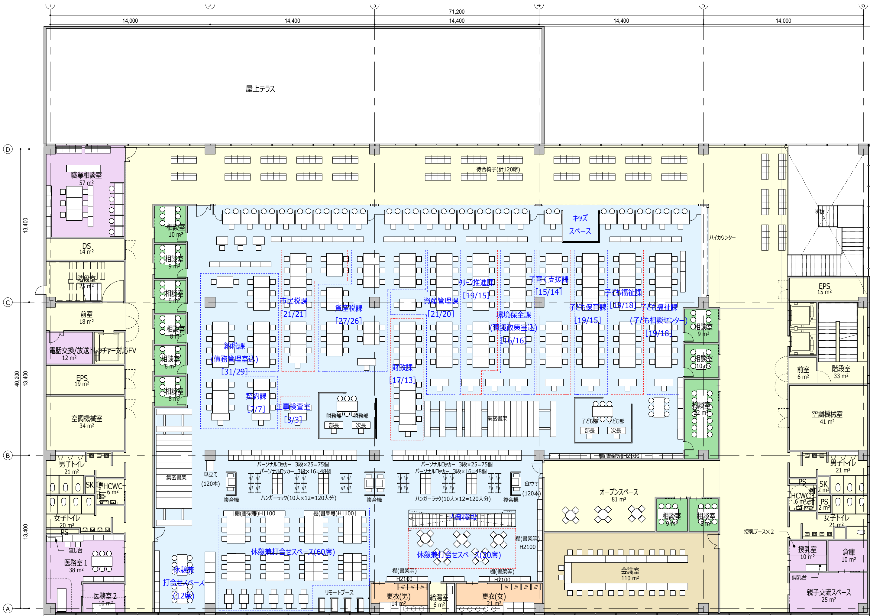
■ 2階平面図 2,870㎡ A3:1/200