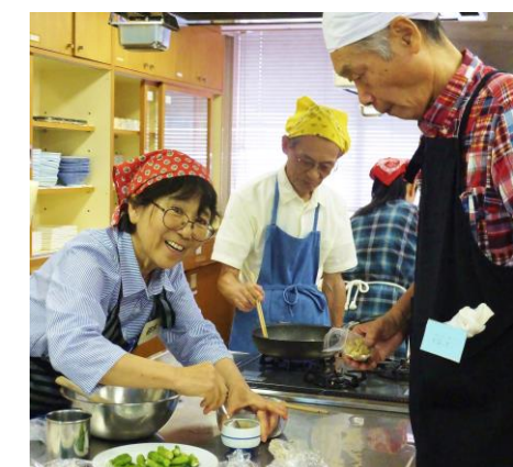
▲前回はくるみを使った料理に挑戦

◇日程と内容 1月23日(金)10時～1時30分 ◇対象 市内在住または在勤の人 ◇参加費 500円(材料費と保険代) ◇定員 16名 ◇持ち物 エプロン・三角巾・布巾2枚 ◇保育 2歳～6歳まで。要予約で先着5名 ◇申し込み 12月15日(月)から電話で同センター☎(485)6505 か直接窓口へ