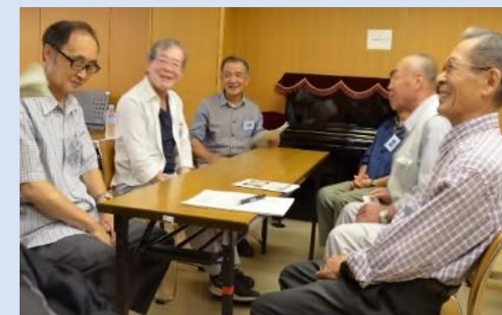
▲自己紹介では、少しずつ打ち解けて素敵な笑顔がこぼれました

12月まで郷土博物館を中心に八千代の歴史などに触れながら、新しい仲間と大いに話して笑って、地域での輝きあるセカンドステージを目指します。