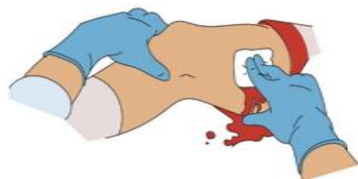
手袋を使用する場合

止血法は、出血している部位を直接圧迫する、直接圧迫止血法が基本です。清潔なガーゼ、ハンカチ等を重ねた状態で傷口に当て、その上から強く圧迫します。