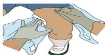
ビニール袋を使用する場合