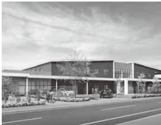
▲児童発達支援センター・すてっぷ21大和田の整備イメージ

【障害者支援】児童発達支援センター・すてっぷ21大和田の更新に向け、新施設の建設工事等を行うとともに、現児童発達支援センターの解体工事実施設計を行います。