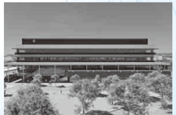
▲新庁舎の整備イメージ

【公共施設等の一体的なマネジメントの推進】設計施工一括発注方式により新庁舎建設工事に着手します。