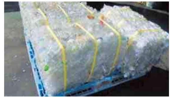
▲正しく分別されたペットボトルは回収・圧縮され、新しいペットボトルに水平リサイクルされます

ている新聞紙やダンボールなどの紙類も良い状態のままリサイクルするため、なるべく雨の日は避けて出してください。