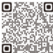
▲地方税お支払サイト

eL-QRを各社のスマホ決済アプリで直接読み取り、お支払いができます。対象となる各社アプリについては、右のコードから地方税お支払サイトをご確認ください。