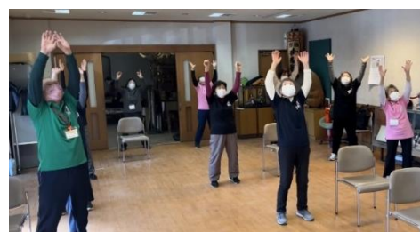
▲ 体操グループの活動の様