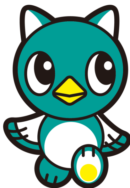
八千代市イメージキャラクター「やっち」