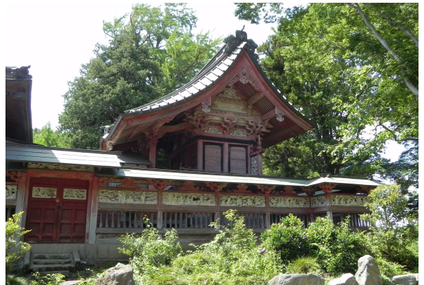
飯綱神社本殿・玉垣

参道石段は高さ 14m，総延長 22.9m，幅 2.65m で 58 段あります。天保 3 年（1822 年）に当時の石段が大破し、当時