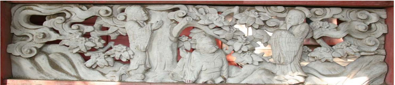
② 田眞 田廣 田慶