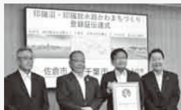
▲8月24日の登録証伝達式 右から八千代市長、千葉市長、佐倉市長

「印旛沼・印旛放水路かわまちづくり計画」は、千葉市・佐倉市・八千代市の3市が推進主体となり、河川管理者である千葉県との連携のもと、6年度から10年度までの5年間で、親水性に資する整備などを推進することで、沿川エリア全体の魅力向上と賑わい創出を図る計画です。8月10日に国土交通省のかわまちづくり支援制度により登録されました。計画書は市ホームページのほか、市役所法務課情報公開班で閲覧できます。(企画経営課 421-6701)