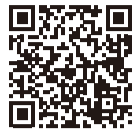
▲第3次健康まちづくりプランの紹介