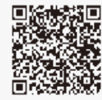
▲観光協会ホームページ

（二社）八千代市観光協会主催のフォトコンテストを開催します。八千代の秋を感じさせる写真を募集します。参加無料。 ▼募集期間 12月1日(金)まで ▼応募方法 八千代市観光協会ホームページまたはインスタグラムから ▼応募資格 誰でも参加可能 ▼応募上の注意 第三者の肖像、プライバシーおよび著作物等を含む作品の場合は当該権利者からの事前使用許諾・承認を受けた上で応募ください。問い合わせは八千代市観光協会☎(407)0192または同協会ホームページをご確認ください (観光推進室☎(421)6762)