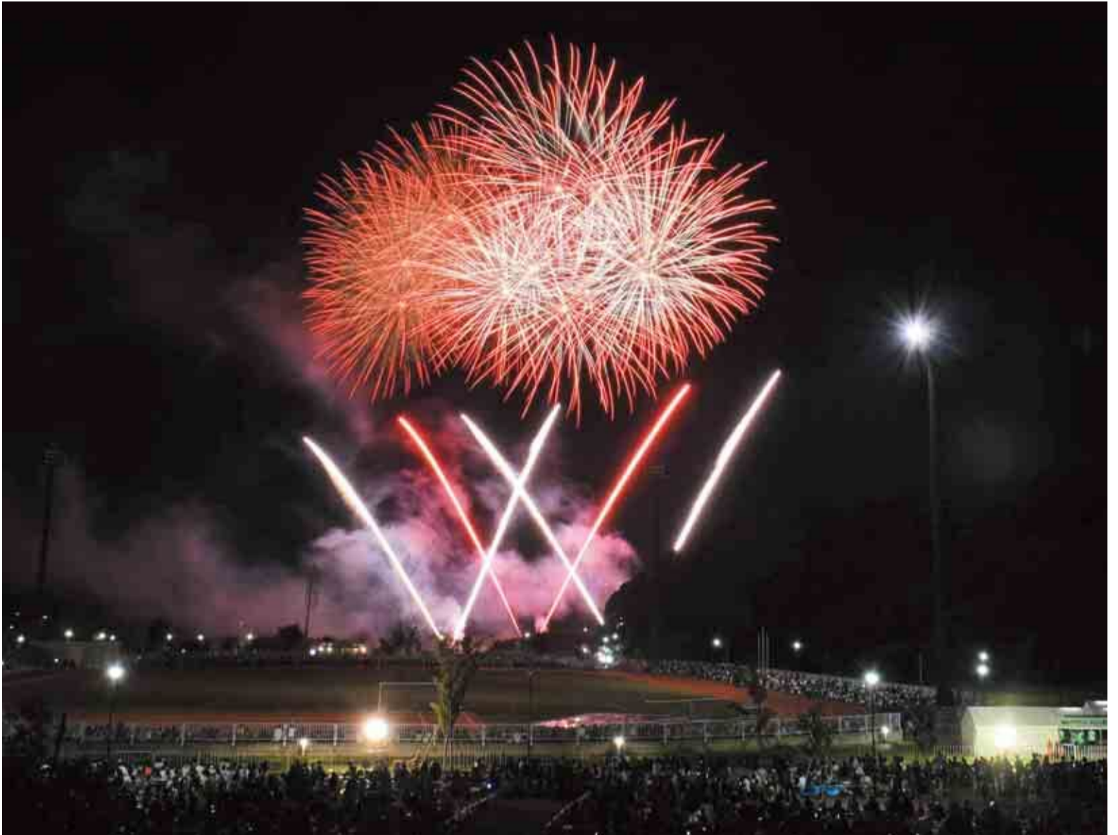
▲TRC八千代中央図書館からの撮影。夏を締めくくる色鮮やかな花火に大きな歓声があがりました

8月26日に「第49回八千代ふるさと親子祭」が開催されました。今年は約17万人が来場。当日は例年のステージイベントなどは行われませんでした。灯ろう流しや模擬店の出店、フィナーレを飾った5,000発の打ち上げ花火が夜空を彩り、訪れた人々を魅了しました。コロナ禍を経て4年ぶりの開催。夏の風物詩を待ちわびた多くの人たちにとって、特別な思い出になったのではないのでしょうか。